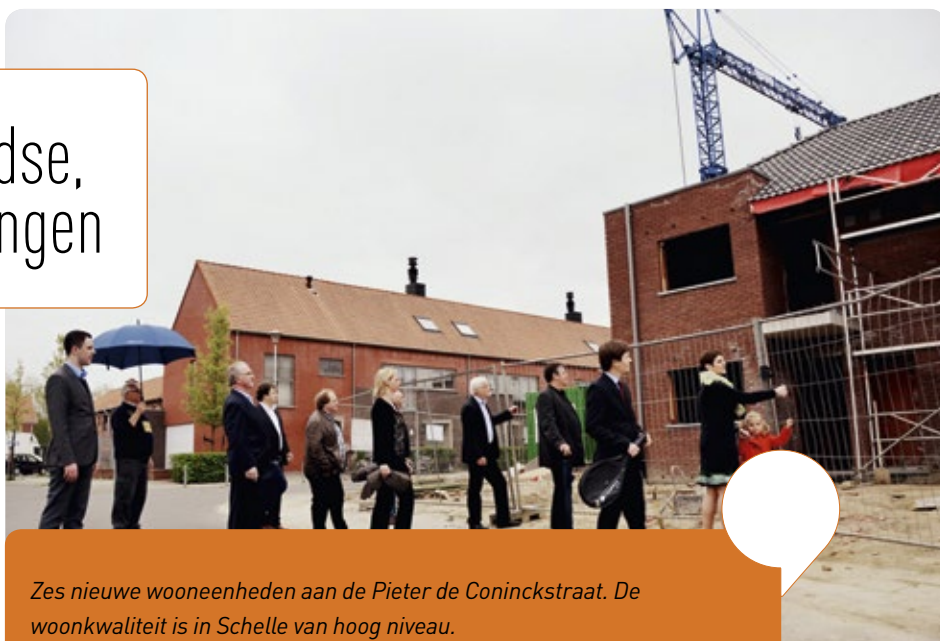
Zes nieuwe wooneenheden aan de Pieter de Coninckstraat. De woonkwaliteit is in Schelle van hoog niveau.

In de Pieter de Coninckstraat werden vier oude huizen afgebroken. Op die plek zijn nu zes wooneenheden in aanbouw. Uiteraard wordt hierbij – in de beste Schelse traditie – alle aandacht besteed aan duurzaamheid en eigentijds comfort. Vlaanderen stopte in deze realisatie ongeveer 800.000 euro: de zoveelste investering die onze gemeente van ministers met CD&V-signatuur mocht ontvangen. In dezelfde straat werden eerder alle huizen heropgebouwd. Qua woonkwaliteit staat Schelle mee aan de top in Vlaanderen. En niet te vergeten: 13 procent van de Schelse huizen zijn sociale huurwoningen.