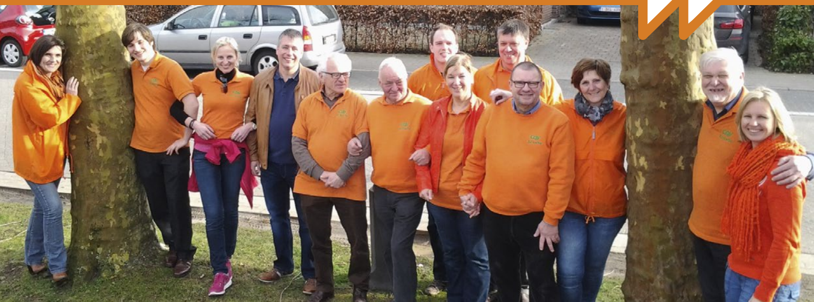
CD&V-bestuursleden poseren tussen de 'knuffelbomen'.