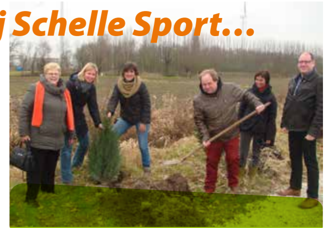
Bestuursleden van CD&V-Schelle planten coniferen aan, afkomstig van een Schelse handelaar.