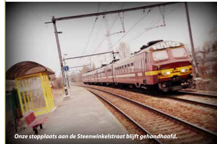
Onze stopplaats aan de Steenwinkelstraat blijft gehandhaafd.