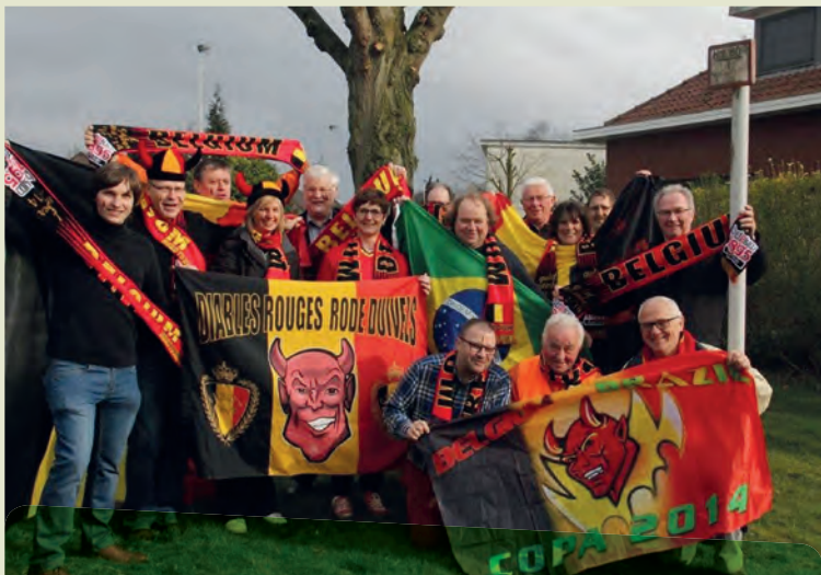
De Schelse CD&V-bestuursleden huldten zich in juni in Rode Duivels-uitrusting om de WK-prijsvraag kleur bij te zetten.