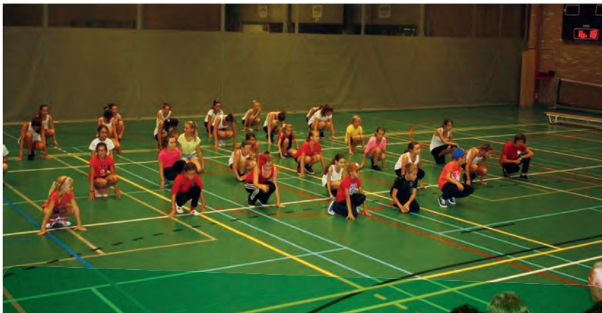
Kinderen in volle actie. En of ze er plezier aan beleefden!

Het succes van deze sport- en spelkampen groeit van jaar tot jaar. Voor het eerst konden de ouders hun kinderen online inschrijven en dat gebeurde op grote schaal: 90 procent! In totaal namen ruim 600 kinderen deel. In 2013 noteerden we zowat 400. De stijging is spectaculair. Geert Rottiers: 'De kampen worden begeleid door geschoolde monitoren. Zij weten er de sfeer in te brengen. Aan deze mensen en aan alle medewerkers van de Dienst Vrije tijd betuig ik uit naam van de ouders mijn grote dank. Er is schitterend werk geleverd...'