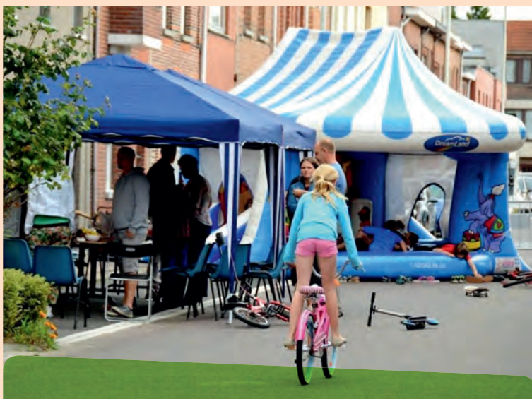
Buurtfeesten en speelstraten brengen gezelligheid voor jong en oud.